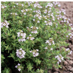
Thymus vulgaris Thymian Thym commun