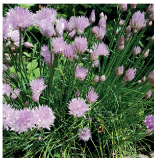
Allium schoenoprasum Schnittlauch Ciboulette