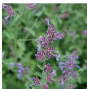
Melissa officinalis Zitronen Melisse Méisse officinale