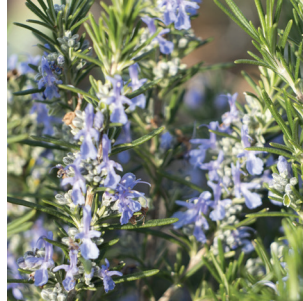
Rosmarinus officinal Rosmarin Romanin