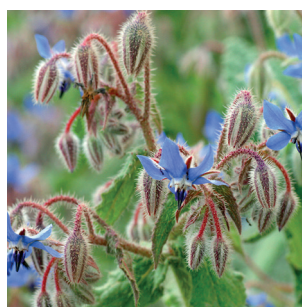
Borago officinalis Borretsch Bourrach