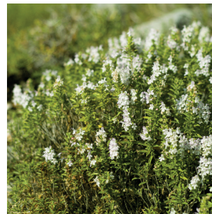
Satureja sp. Bohnenkraut Sariettes