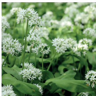
Allium ursinum Bärlauch Ail des ours