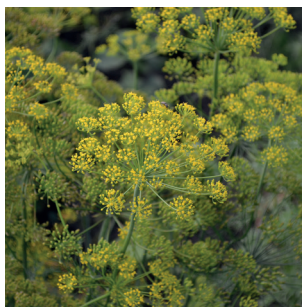
Anethum graveolens Dill Aneth