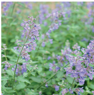
Salvia officinalis Echter Salbei Sauge officinale