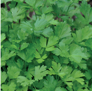
Petroselinum sativum Glatte Petersilie Persil plat