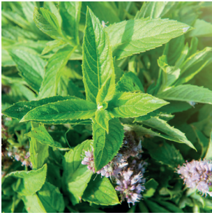
Mentha sp. Minze Menthes