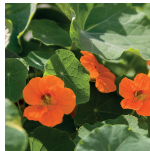
Tropaeolum sp. Kapuzinerkresse Capucine