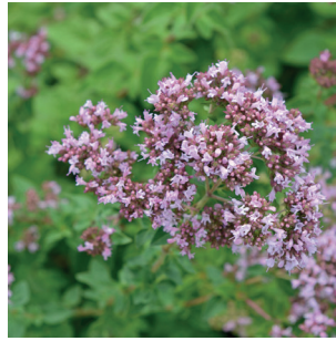
Origanum sp. Oregano /Majoran Origon / marjolaine