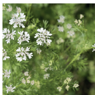
Coriandrum sativum Koriander Coriandre