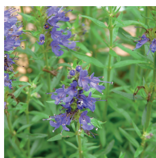
Hyssopus officinalis Ysop/Bienenkraut Hysope