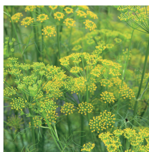
Foeniculum vulgare Fenchel Fenouil