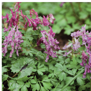
Corydalis Lerchensporne Corydalis