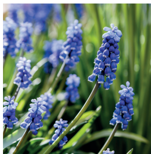
Muscari armeniacum Traubenhyazinthe Muscari d'Arménie