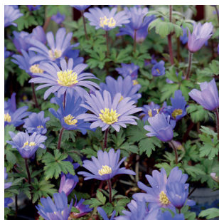
Anemone blanda Balkan-Windröschen Anémone de Grèce

Nos magasins partenaires vous proposent au moins 3 des bulbes à fleurs présentées dans le tableau suivant, en qualité biologique.