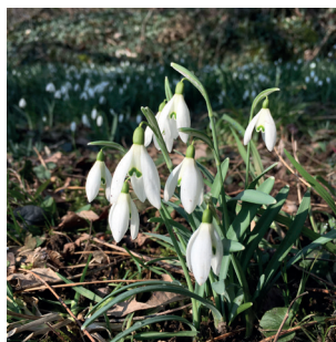
Galanthus nivalis Schneeglöckchen Perce-neige