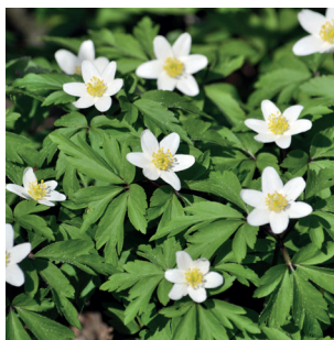
Anemone nemorosa Buschwindröschen Anémone des bois