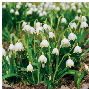
Leucojum vernum Märzenbecher Nivéole de printemps