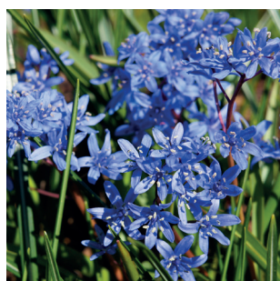
Scilla bifolia Zweiblättriger Blaustern Scille à deux feuilles