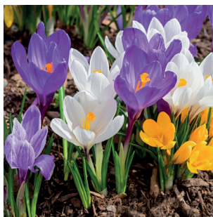
Crocus Krokus Crocus