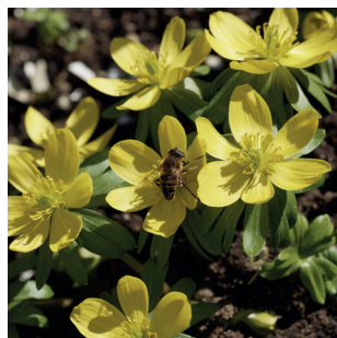
Eranthis hyemalis Winterling Hellébord d'hiver