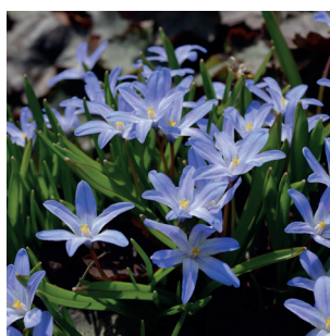
Scilla siberica Sibirischer Blaustern Scille de Sibérie